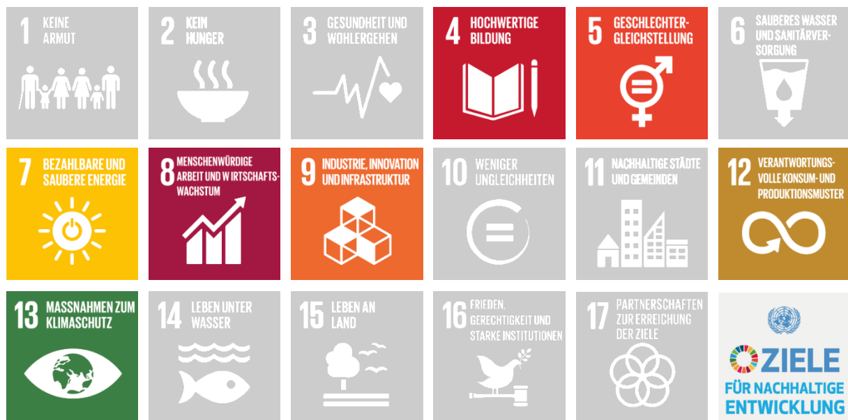
Abbildung 2 SDGs, die mit den Skills-Initiativen adressiert werden